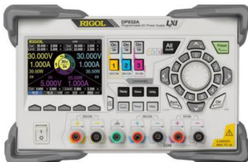
Рисунок 4 - Передняя панель источников модификаций DP831/DP831A, DP832/DP832A