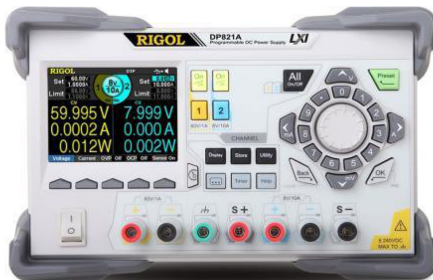
Рисунок 3 - Передняя панель источников модификаций DP821/DP821A, DP822/DP822A