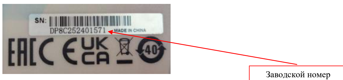
Рисунок 6 – Фрагмент задней панели источника с этикеткой