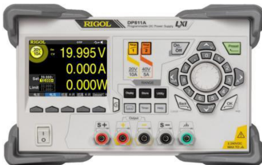
Рисунок 1 - Передняя панель источников модификаций DP811/DP811A, DP813/DP813A